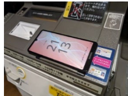
スマホ用電子証明書（利用者証明用）が 搭載されたスマートフォンをキオスク端末にか ざす（置く）