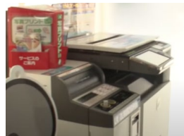
コンビニのキオスク端末