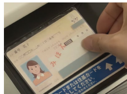
マイナンバーカードを キオスク端末にかざす（置く）