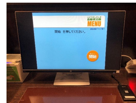
自動貸出機とICカードリーダー