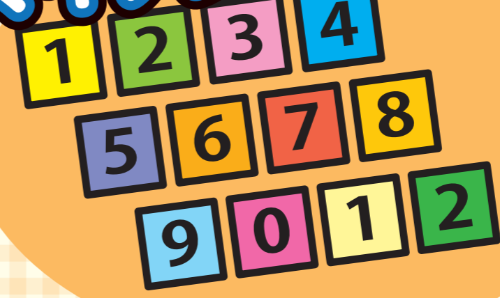
マイナンバーPRキャラクター マイナちゃん