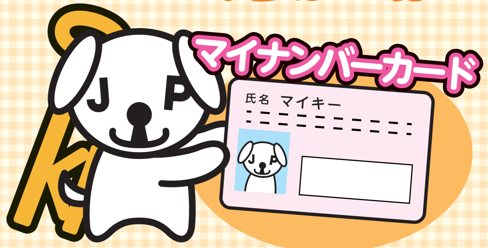
公的個人認証サービス PRキャラクター マイキーくん