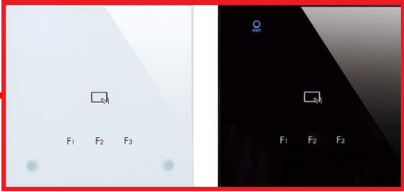
入退室・出退勤カードリーダー

マイナンバーカードの空き領域(拡張利用領域)に土庄町入退室・出退勤管理システム用カードAPを搭載。