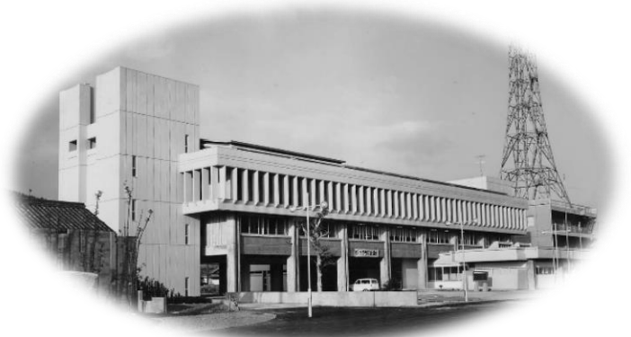
昭和46年建設の旧庁舎

新庁舎建設に併せてマイナンバーカードを活用した庁舎入退室・出退勤管理システムを構築し、改善を図る。