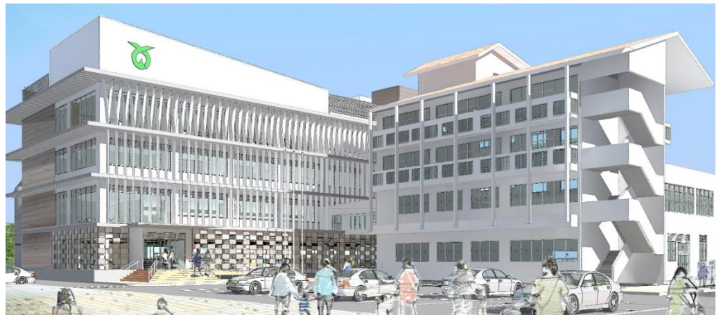
新庁舎(イメージ図)