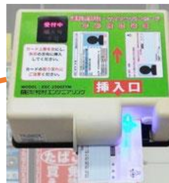
(参考図表) 自動販売機