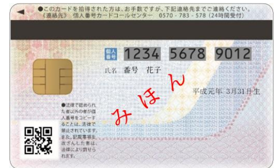
現行のマイナンバーカード（うら面）