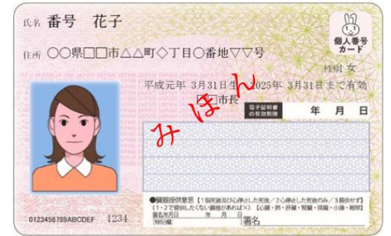
現行のマイナンバーカード（おもて面）