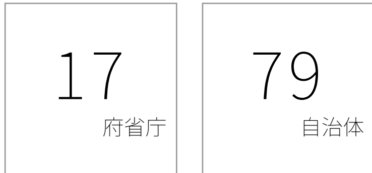
利用府省庁・自治体のべ数