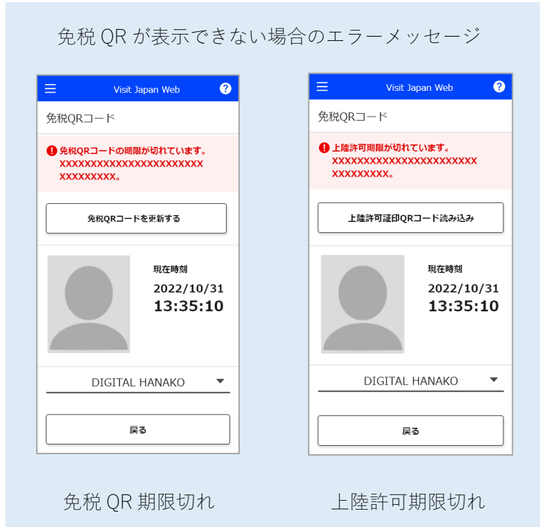
免税 QR 期限切れ