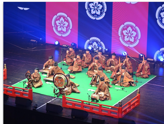
▲ 実際のイベントの様子