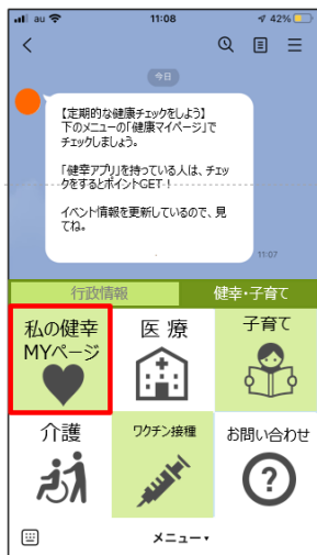
【自治体公式LINEアカウント】