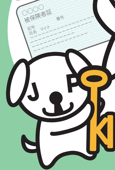
マイナンバー-PRキャラクター マイナちゃん