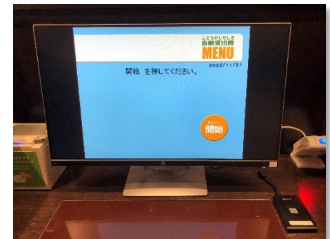
自動貸出機とICカードリーダー