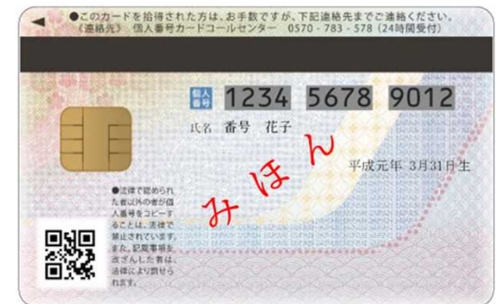
現行の個人番号カード（うら面）