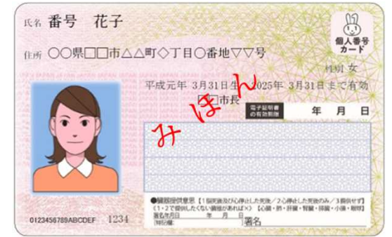
現行の個人番号カード（おもて面）