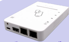
かざしリーダー 改正公的個人認証法対応

マイナンバーカードをかざすだけで本人確認が出来る 民間事業者向け「かざしリーダーセット」