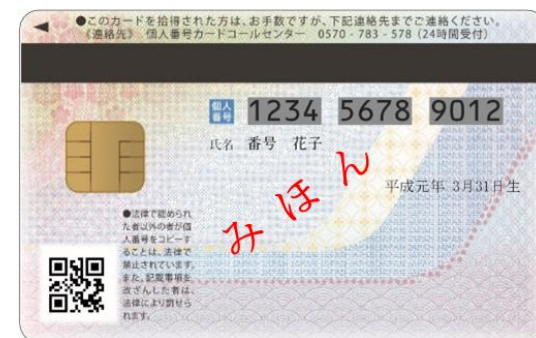
現行のマイナンバーカード（うら面）