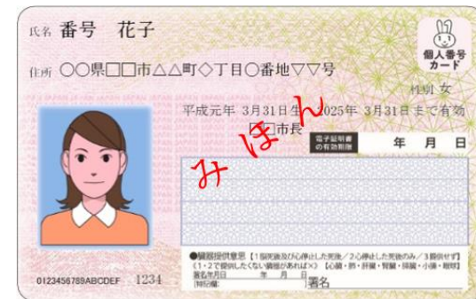
現行のマイナンバーカード（おもて面）